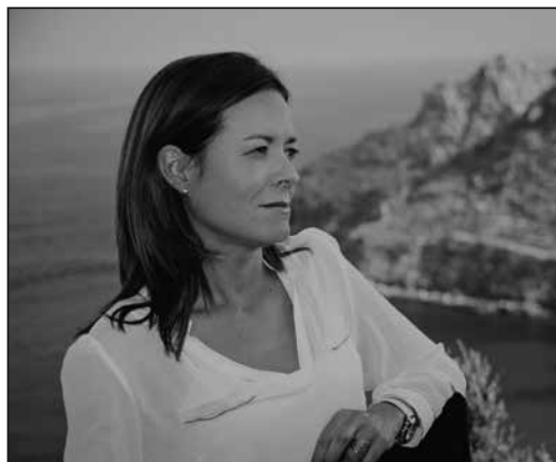
Mari Carmen Moreno , portavoz del Grupo Municipal Socialista y diputada regional del PSOE.